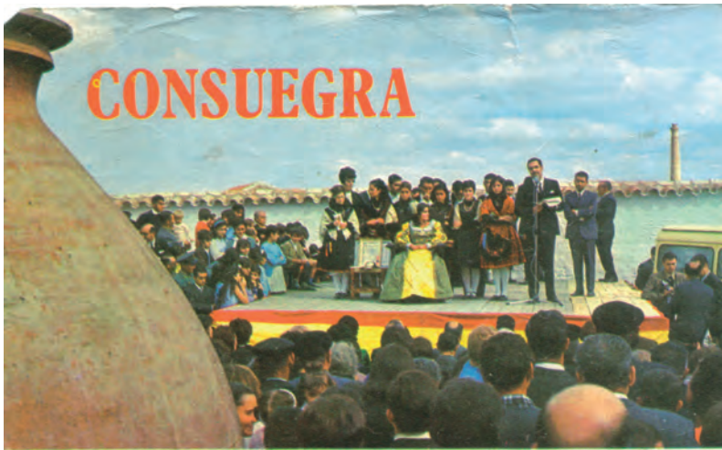
Alfar 1967 Pregón de la Rosa