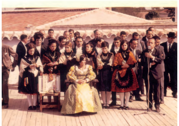
Alfar 1967 Proclamación de la Dulcinea