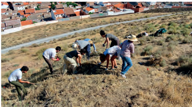
II. Excavación y sondeos de la presa romana y prospecciones en la zona sur del término municipal (paraje de los Estanques Romanos, Minas, etc.). Del 1 al 19 de septiembre.