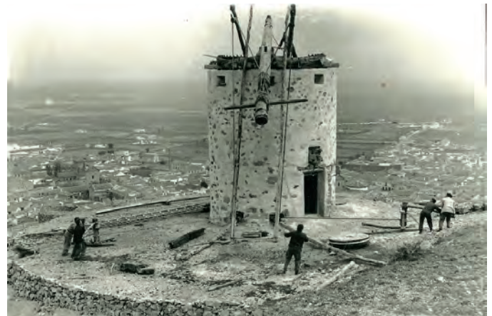
El molino Sancho en construcción