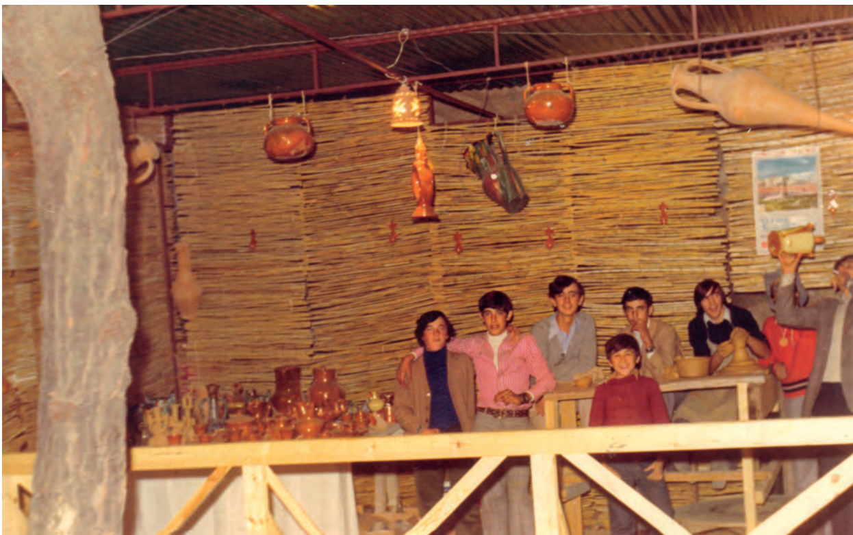
XI Fiesta de la Rosa 1973 Stand en el Paseo