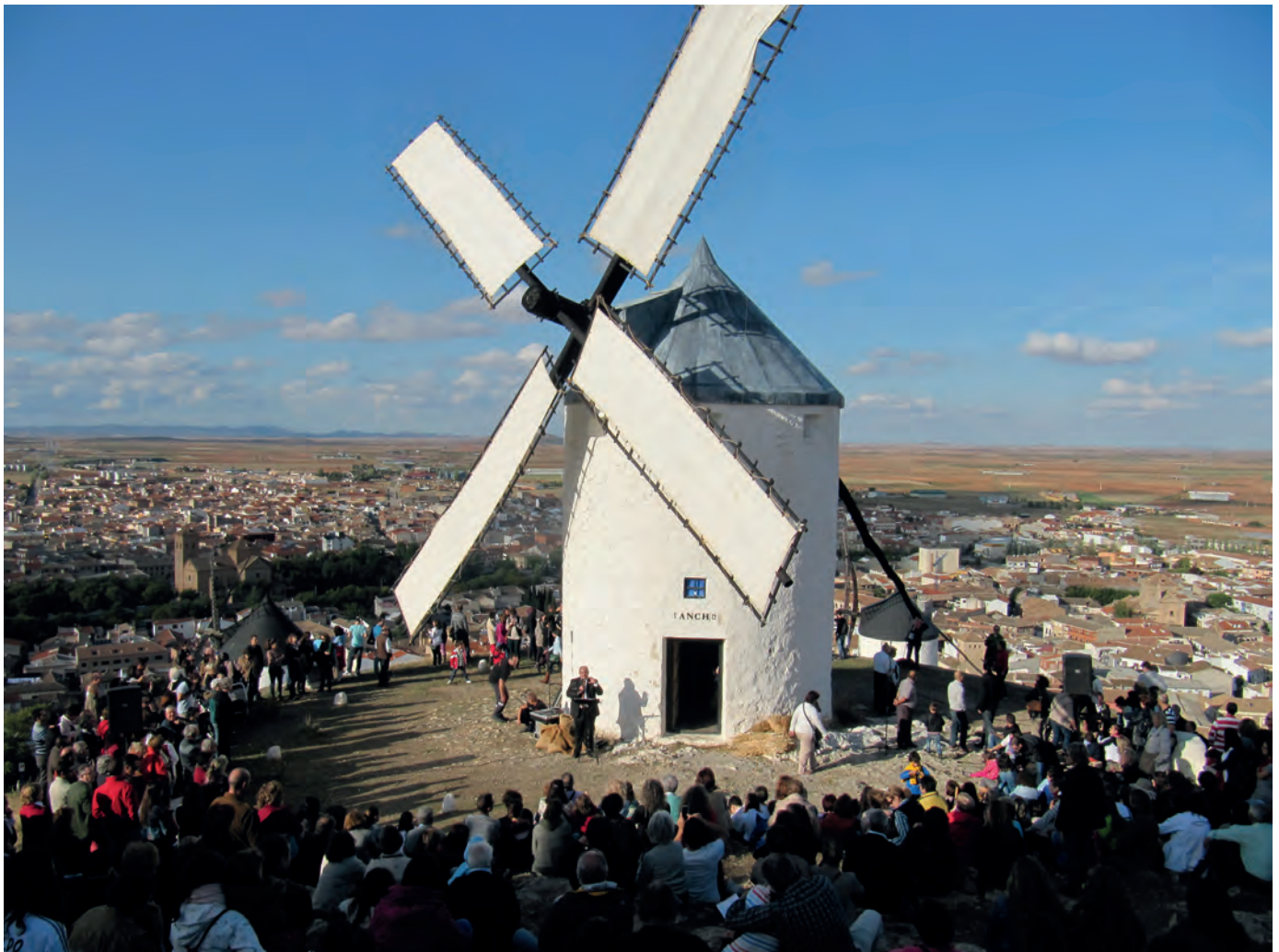
Molienda del pasado año

(Círculo Cultural Consaburenses y Centro de Estudios Consaburenses F. Domínguez Tintero.)