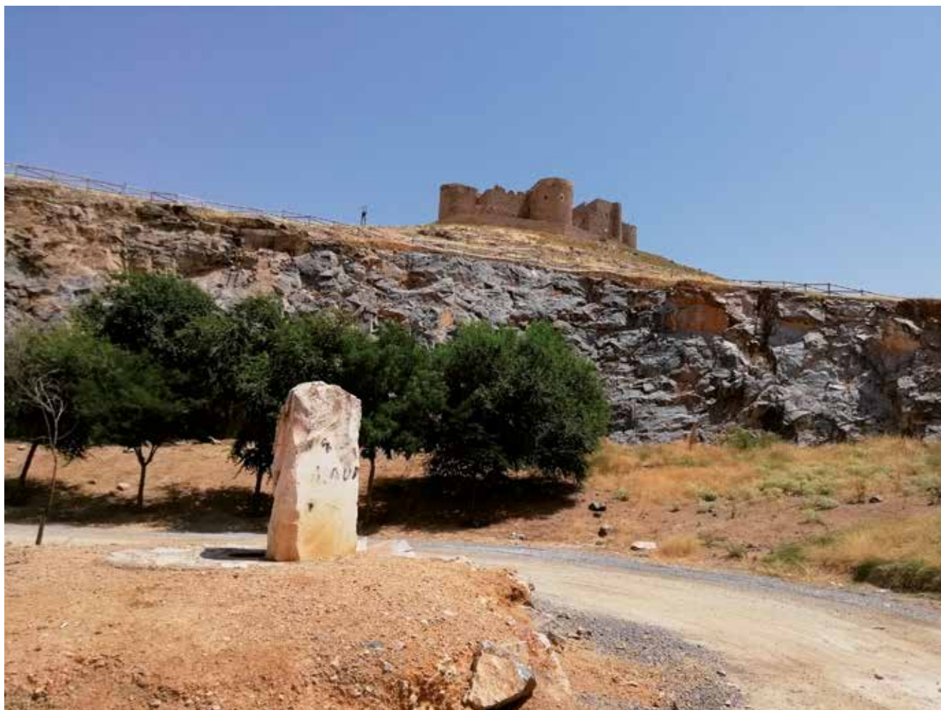
Las Canteras del Castillo.