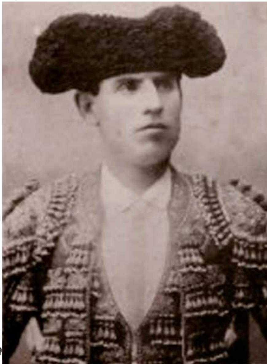
El torero Pepe-Hillo

Como puede verse, en muchos aspectos, nuestra feria, adaptándose a los tiempos, permanece invariable.