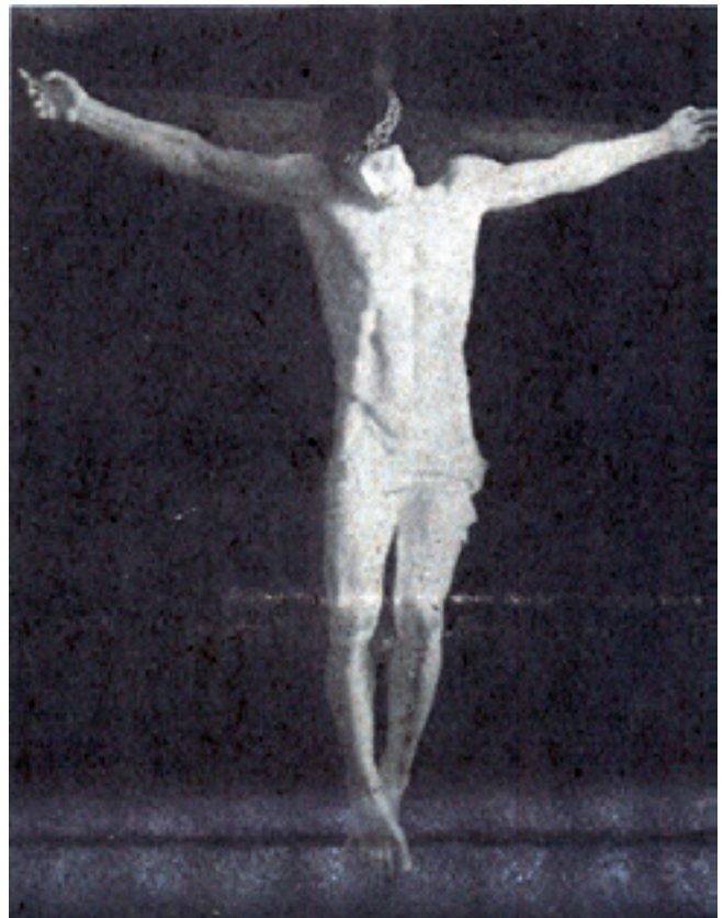
Modelo en escayola, reproducción de la talla del Stmo. Cristo de la Vera Cruz (La Estafeta Literaria nº 10, de 10 de agosto de 1944)