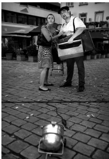
En una función en la calle en Wiestloch, Alemania

Entre sus producciones también destaca “Salud, Suerte y Ánimo” ganadora del premio al montaje y a la interpretación femenina en el Certamen Internacional Noctívagos de Oropesa 2012 y con la que hemos desarrollado una gira Nacional que cuenta ya con más de 100 representaciones en las comunidades de Madrid, Murcia, Castilla León y Castilla La Mancha, País Vasco, Asturias, Galicia y Cantabria. Esta obra, concebida para su representación en la calle , también ha girado fuera de España, participando en el Fringe de Edimburgo y haciendo gira en 8 diferentes estados de México. Así mismo, “Salud, Suerte y Ánimo” se ha representado en contextos docentes, colaborando con la Universidad de Castilla La Mancha y con la Universidad de Guadalajara (Jalisco, México).