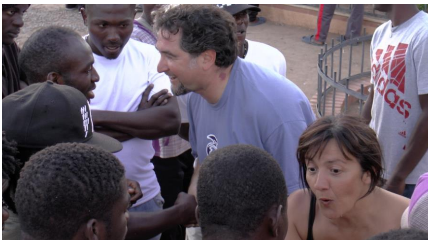
En la puerta del CETI en Melilla, tras la representación de Salud, Suerte y Ánimo.

Pero sin duda, en la historia de “Salud, Suerte y Ánimo” destaca la gira del verano de 2014 en la que se realizó una gira de emigrantes desde la valla de Melilla (Frontera Sur de Europa) hasta la Puerta de Brandemburgo (Berlín) .