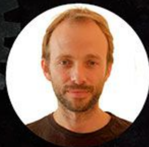
Iván Monje Música original