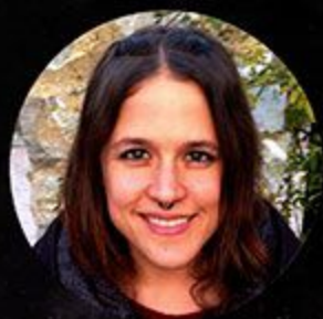
Almudena Oneto Diseño de iluminación