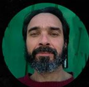
Carlos Monzón Escenografía