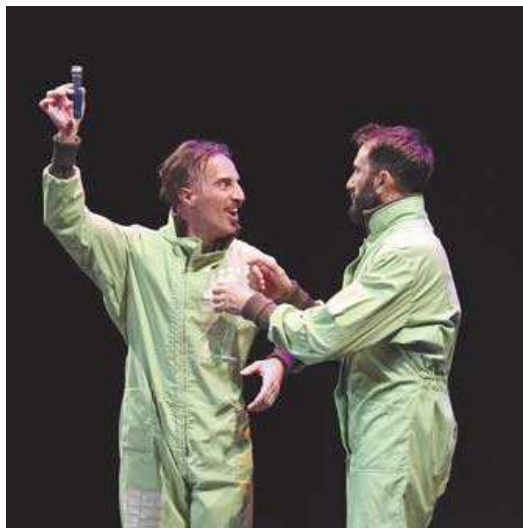
Un momento de la representación en el Gayarre.