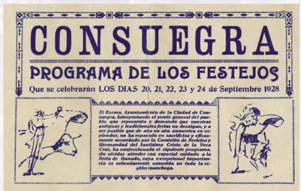
PORTADA DEL PROGRAMA DE FERIAS DE CONSUEGRA DE 1928