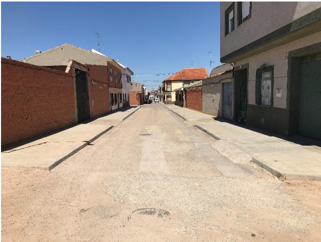
F CALLE LA FÁBRICA