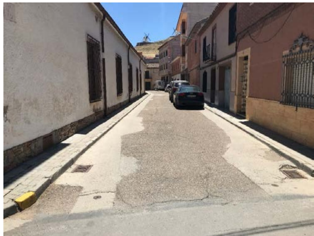
E CALLE DON PEDRO TORRES Desde Velázquez hasta las afueras