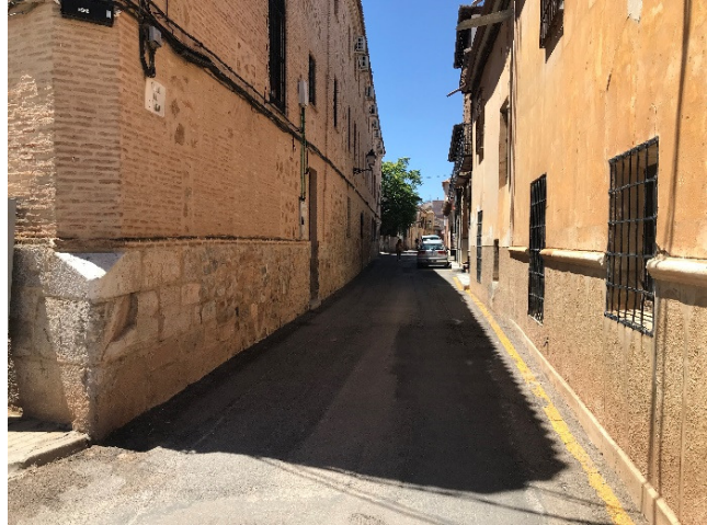
D CALLE FANTACA