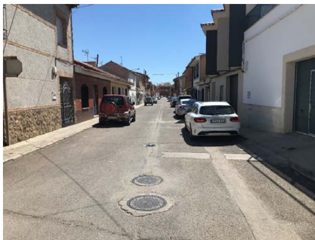
8. CALLE SAN PEDRO DE ALCÁNTARA (Desde Cleopatra hasta Stas. Justa y Rufina)