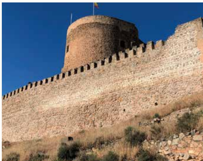
Resultado tras los trabajos de consolidación en fábricas exteriores