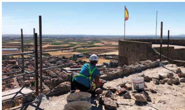
Trabajos de restauración en el torreón norte

Se ha procedido a regularizar el muro perimetral de coronación de la torre apoyándonos en los testigos encontrados, para así poder ejecutar el sistema de cubierta y desagüe de la misma; así como la reconstrucción ya documentada en trabajos anteriores, de la ventana en torno al hueco situado en la parte superior del lienzo este.