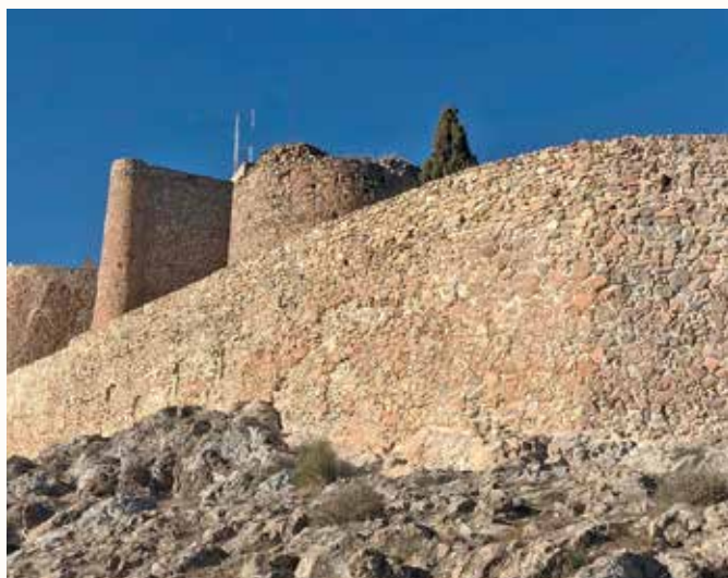
Resultado tras los trabajos de consolidación en fábricas exteriores