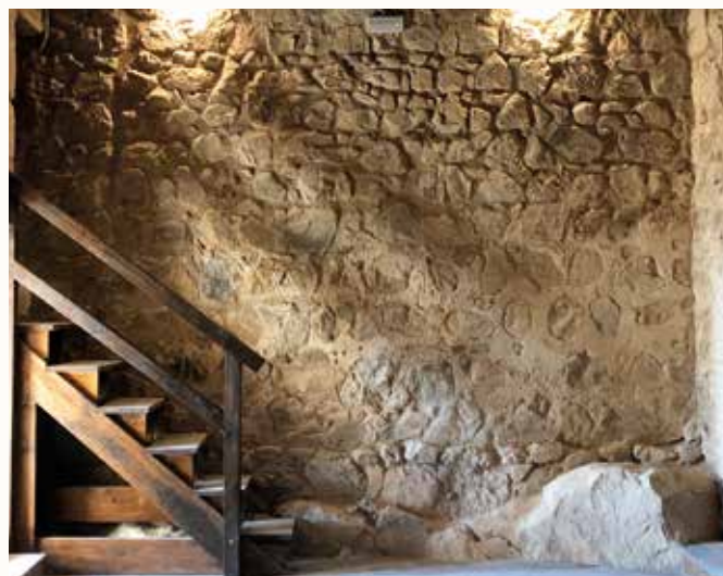
Resultado tras los trabajos en nivel inferior torreón norte

Sobre los revocos históricos documentados tras la limpieza y desescombro se han realizado trabajos de mantenimiento y consolidación, para su correcta conservación. En el nivel superior, la bóveda de cubierta se ha revestido mediante un revoco a la cal, al igual que podemos encontrar en otras salas del castillo.