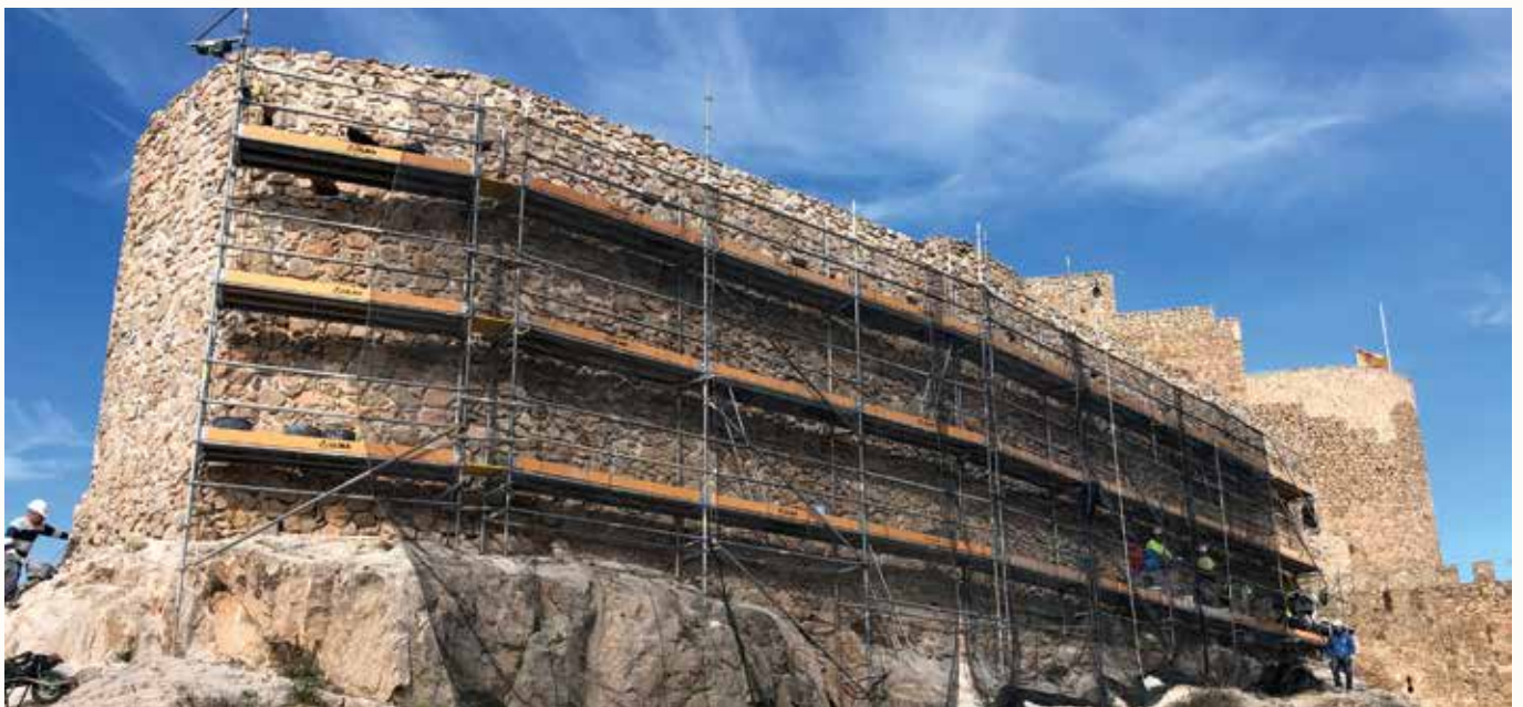
Trabajos de consolidación en fábricas exteriores del tercer recinto amurallado

Además, estos trabajos preliminares se han complementado con el estudio y análisis de los lienzos murarios objeto de intervención en esta fase y la siguiente, a fin de documentar su evolución histórica