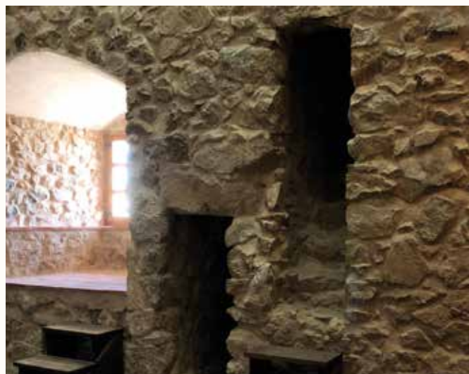
Resultado tras los trabajos en nivel superior torreón norte