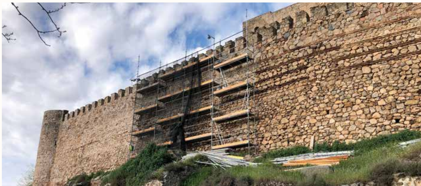
Trabajos de consolidación en fábricas exteriores del tercer recinto amurallado

y constructiva, pudiendo realizar un diagnóstico por menorizado de sus patologías.