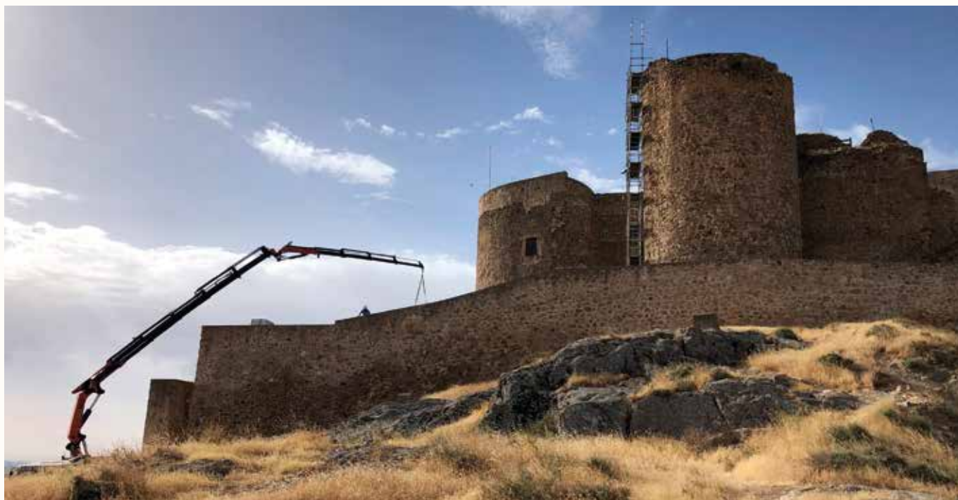
Inicio de las obras de la primera fase