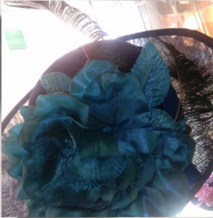
Salón de belleza y peluquería.