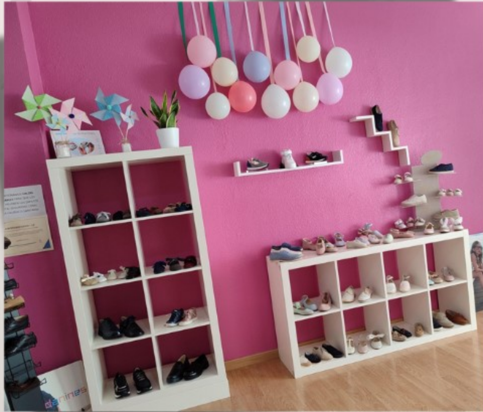
Calzado infantil y juvenil.