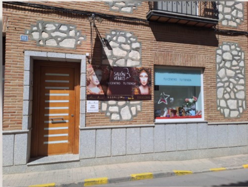
Salón de belleza y peluquería.