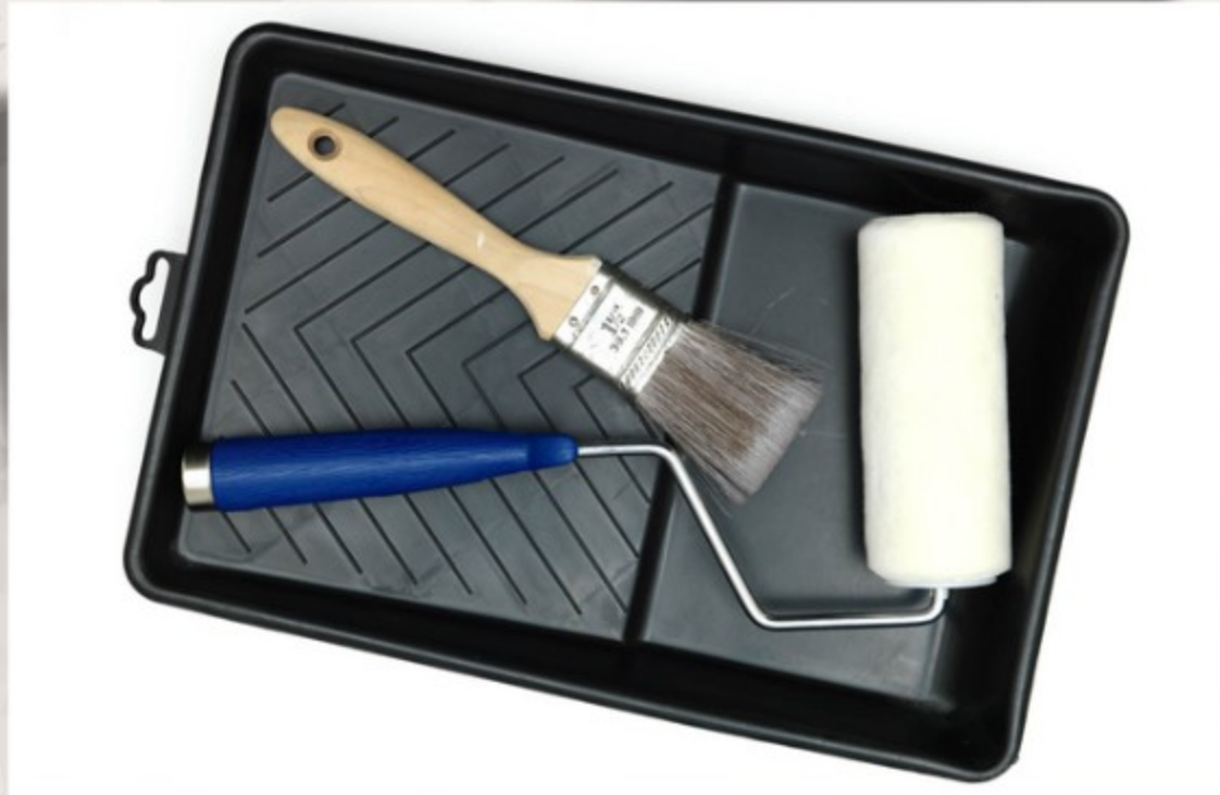
Pintura y decoración.