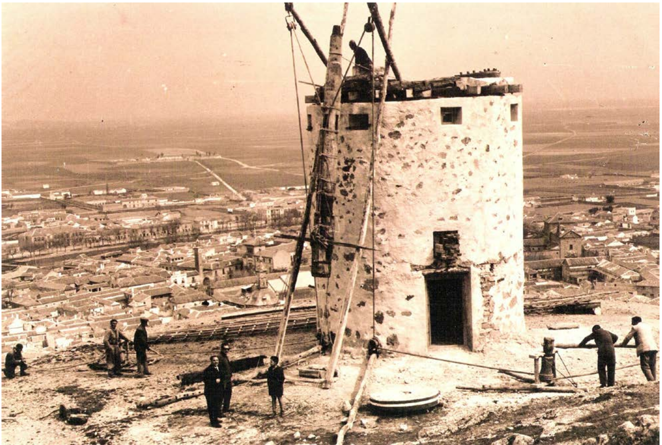
Construcción de Molino de Viento en Cerro Calderico. Años 60.