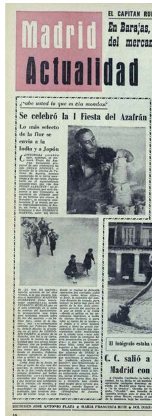
Pueblo Diario del Trabajo Nacional de 28-10-1963

Una fiesta como la de la Rosa del Azafrán de Consuegra, con las ediciones que lleva celebradas, con la repercusión mediática y social que provocó desde sus inicios y con la esencia manchega que promueve y difunde, ha ido dejando una estela maravillosa de noticias, reportajes y documentos, que ahora, después de sesenta y tres años nos sirven para entender mejor la fiesta, la manera en que surgió y como ha ido adaptándose y creciendo a lo largo de los años.