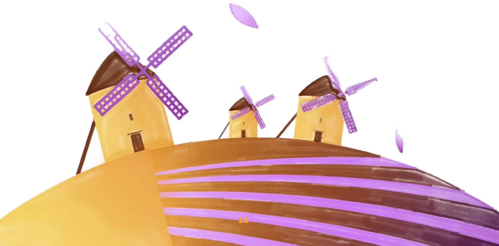
La Voz de Albacete de 04-11-1969