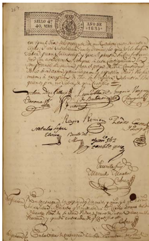
Ref. Sig. AMC 2/002-Libro de Acuerdos 1832-1835 (hojas 266-288). Acta 7 de septiembre de 1835.