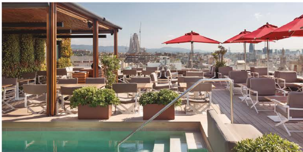
La Dolce Vita , con sus vistas panorámicas de la ciudad, premia la mejor terraza de hotel de Europa

En materia de calidad y medioambiente, el hotel busca alternativas que protejan y cuiden su entorno: restaurante slow food Km.0 , Spa con marcas respetuosas con el medio ambiente y sus “Majestic Experiences” como “Farm to table” , una experiencia en la que visitar su huerto de Argentona y las bodegas de agricultura ecológica Alta Alella. También se fomenta el transporte verde y actividades saludables durante el año como clases de yoga, nutricionista...etc.